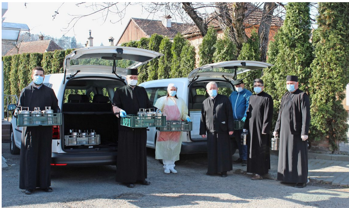
Priester und Chauffeure liefern Mahlzeiten zu armutsbetroffenen Menschen nach Hause.

In Rumänien ist die Lage aber weit misslicher als hier in der Schweiz. Im Tages- und Nachtzentrum in Sighisoara ist der Arbeitsaufwand gestiegen: Zwei Chauffeure liefern seit Mitte März betagten Nutzniessern des Tageszentrums die Mahlzeiten nach Hause, da sie nicht mehr ins Zentrum gefahren werden dürfen. Armutsbetroffene Personen, die mobil sind, dürfen die Mahlzeiten weiterhin zur Mittagszeit im Zentrum abholen. Vor Ort werden zudem Obdachlose betreut und verköstigt, wobei das örtliche Rathaus die Zentrumsleitung verpflichtete, weitere hilflose und kranke Menschen zur Betreuung zu übernehmen.