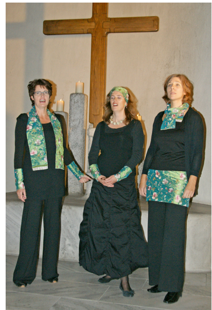
Das Vokaltrio am vorweihnächtlichen Benefizkonzert in der katholischen Kirche in Horgen