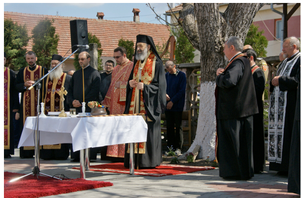
Das «Nachtzentrum» in Sighisoara konnte durch die Unterstützung des Vereins Pro Sighisoara renoviert werden: Im April 2013 weihte es Erzbischof Irineu aus Alba Iulia im Beisein einer Delegation aus der Schweiz ein.